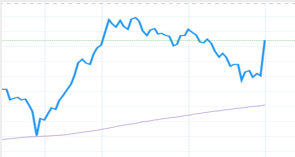
Tổng quan doanh nghiệp