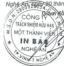
Đặng Xuân Bằng